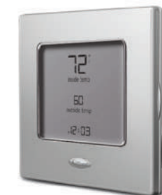
• Comfort programable