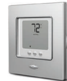
• Comfort no programable