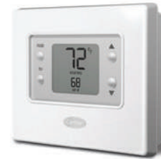
• Comfort no programable