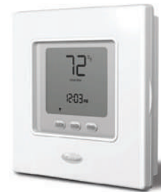
• Comfort programable